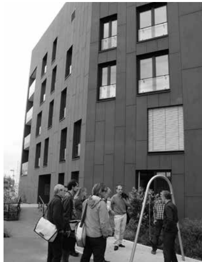
Die Fachgruppe Energieeffizienz IngKH auf ihrer Exkursion zum EnergieHaus PLUS auf dem Frankfurter Riedberg im Oktober 2015

Eis produziert Wärme: Ergänzt werden die Photovoltaikmodule auf dem Dach