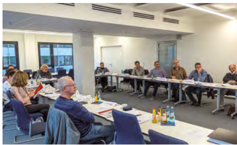
Die Teilnehmerinnen und Teilnehmer des von der Ingenieur-Akademie Hessen GmbH (IngAH) durchgeführten Seminars „Modernes Zeit- und Arbeitsmanagement“